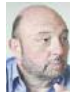
Του Βασίλη Μάστορα

Οι σκηνές που εκτυλίχθηκαν το βράδυ της περασμένης Πέμπτης στα γραφεία της ΕΠΟ στο Γουδί, κατά τη διάρκεια της εκδίκασης των εφέσεων που κατέθεσαν ο Παναθηναϊκός και ο ΠΑΣ Γιάννινα για την αδειοδότηση τους δεν προξενούν καμία εντύπωση.