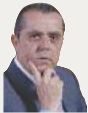
Του Νίκου Καραμανλή

Το 54,9% πιστεύει ότι η Ελλάδα θα βρει το δρόμο της, έναντι 42,8% που πιστεύει το αντίθετο.