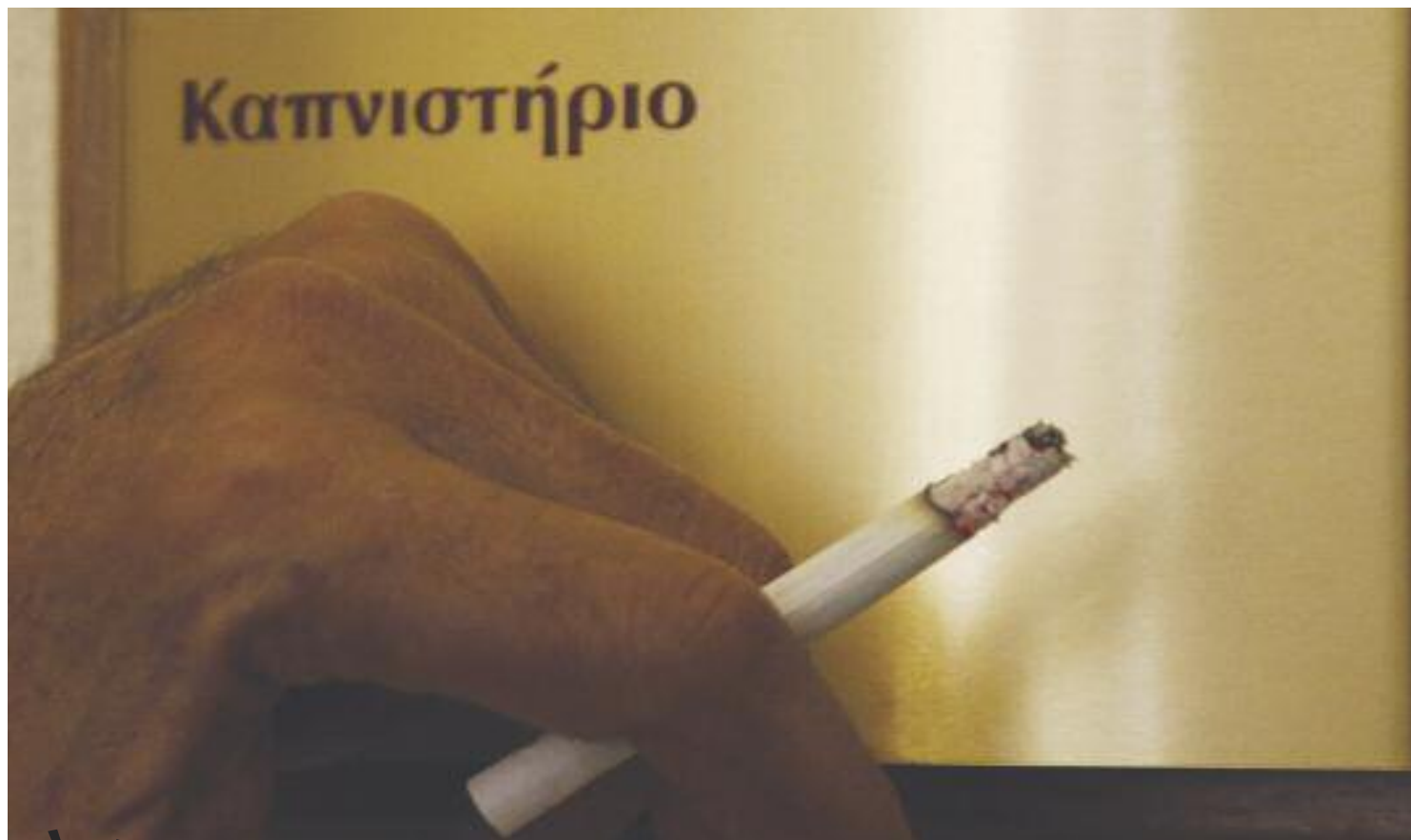
Ούτε τσιγάρο, ούτε καπνιστήριο. Αυτά που ξέρετε να τα ξεχάσετε. Από σήμερα απαγορεύεται το κάπνισμα σε όλους τους εσω- τερικούς χώρους. Πάει το καφέ και τσιγάρο. Τώρα τσίκλα και μεγυλέρι!