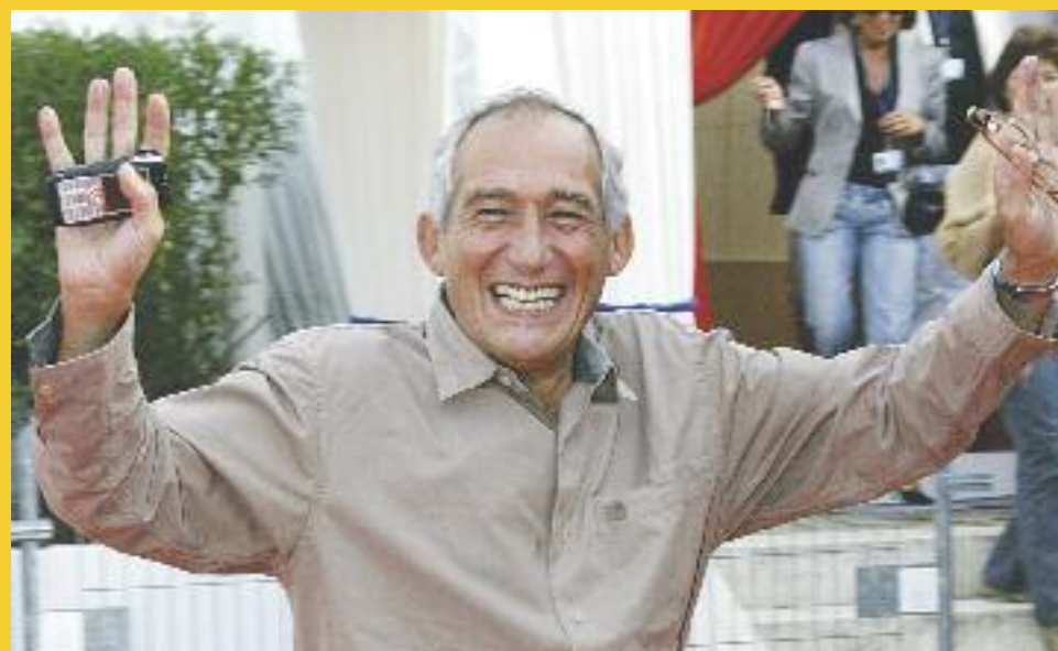
Πέθανε σε ηλικία 67 ετών, ο γάλλος σκηνοθέτης Αλέν Κορνό, αφήνοντας την τελευταία του πνοή σε νοσοκομείο του Παρισιού. Ο γάλλος σκηνοθέτης ήταν ο δημιουργός των ταινιών «Όλα τα πρωινά του κόσμου», «Νυχτερινός Ινδός» κ.α.