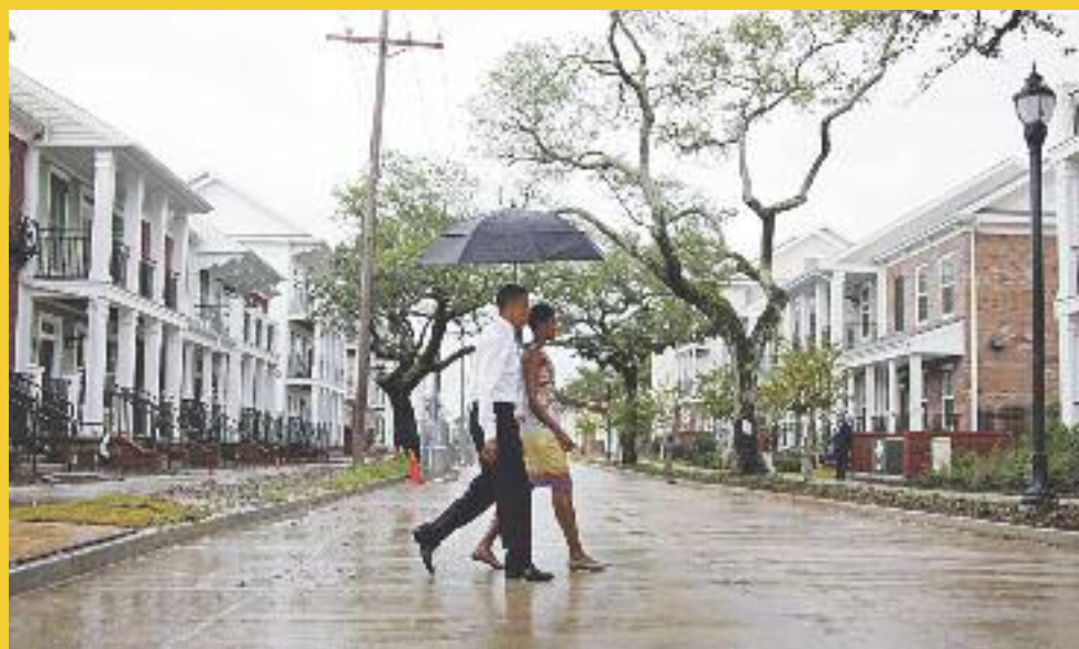
Την Νέα Ορλεάνη επισκέφτηκε ο αμερικανός Πρόεδρος Μπαράκ Ομπάμα, για τη πέμπτη επέτειο από τον τυφώνα Κατρίνα, που χτύπησε τις αμερικανικές ακτές στον Κόλπο του Μεξικού. Στη φωτογραφία ο πρόεδρος των ΗΠΑ είναι μαζί με την γυναικά του Μισέλ Ομπάμα, διασχίζοντας δρόμο στο Κολούμπια Παρκ.