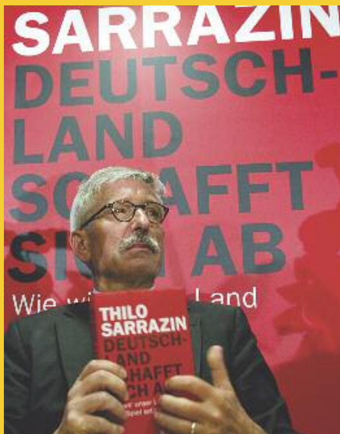
Ένταση προκαλεί στη Γερμανία το βιβλίο που υπογράφει ο Τίλο Σαράζιν (μέλος του Διοικητικού Συμβουλίου της Τράπεζας Bundesbank), ο οποίος μέσα από τις σελίδες του βιβλίου του, προκαλεί σάλο με τα σχόλια περί «εβραϊκού γονιδίου» και κακής επιρροής των μεταναστών στην Ευρώπη.