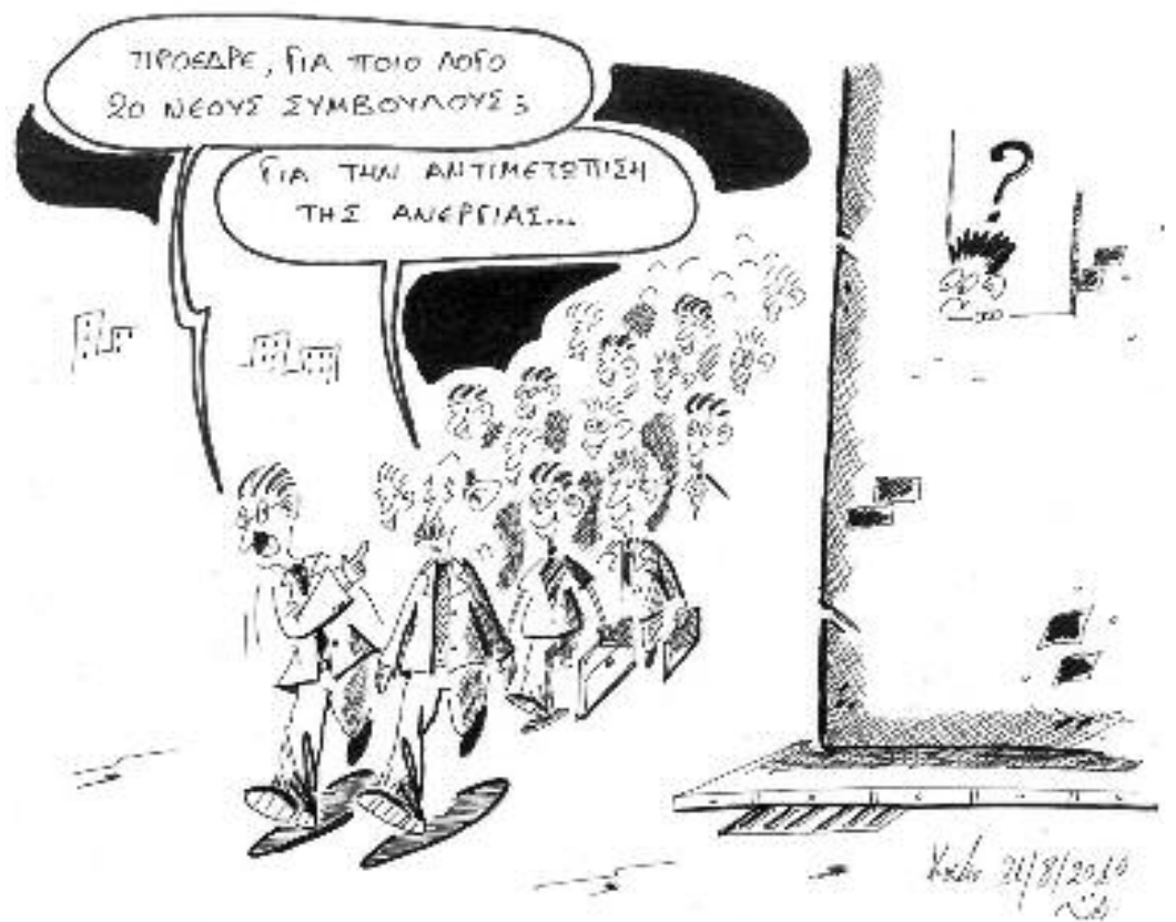
Γελοιογραφία του Δημήτρη Καλαϊτζή

ούτε τον (ασυντόνιστο, σύμφωνα με το 69,8% των πολιτών ) θίασο με τον οποίο μας κυβερνά. Επίσης δεν φαίνεται να προκάλεσε ανησυχία ούτε σε πολλές άλλες «παλιοσειρές» του πολιτικού μας βίοτοπου, οι οποίες συνεχίζουν να πολιτεύονται, ένα βήμα πριν από την καταστροφή, σαν να μην έχουν αντιληφθεί ότι η