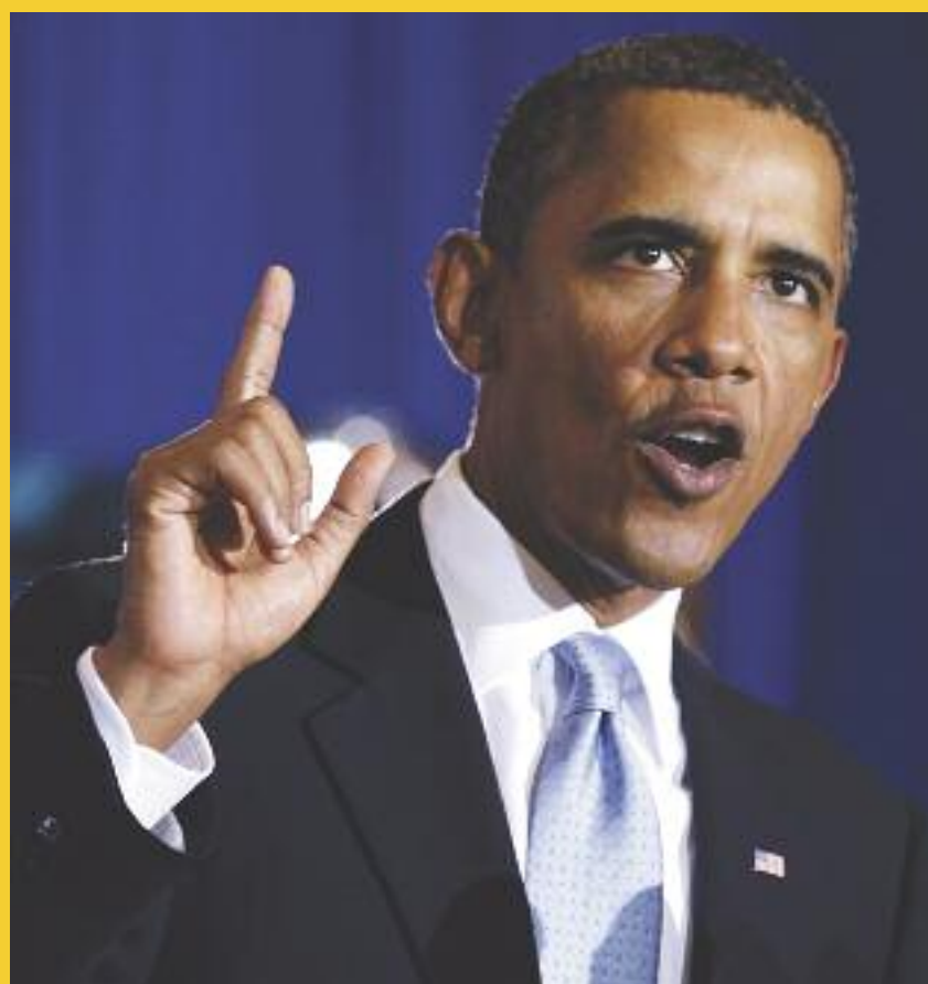
Στις ΗΠΑ θα μεταβούν ο Ισραηλινός πρωθυπουργός Μπέντζαμιν Νετανιάχου και ο Παλαιστίνιος πρόεδρος Μαχμούντ Αμπάς. Οι δυο ηγέτες θα συνομιλήσουν με τον αμερικανό πρόεδρο Μπαράκ Ομπάμα στον Λευκό Οίκο, για την ειρηνευτική συμφωνία των δυο χωρών, ύστερα από 20 μήνες διακοπής των συνομιλιών.