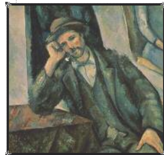
Paul Cezanne «Man Smoking a Pipe», 1895-1900