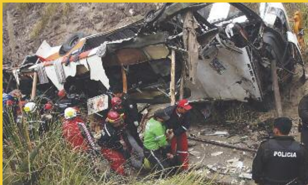
Στον Ισημερινό 38 άνθρωποι σκοτώθηκαν και άλλοι 12 τραυματίστηκαν, όταν λεωφορείο που τους μετέφερε έπεσε σε γκρεμό. Το δυστύχημα σημειώθηκε στην επαρχία Κοτοπάξι, 100 χιλιόμετρα έξω από την πρωτεύουσα Κιτο.