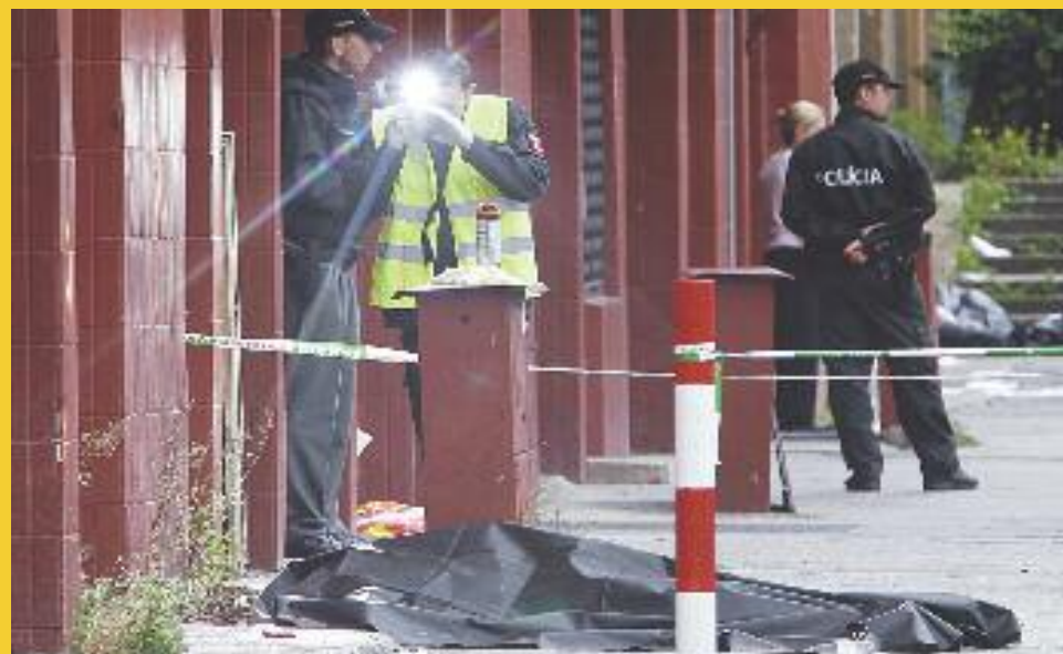
Οπλισμένος άνδρας άνοιξε πυρ σκοτώνοντας 6 ανθρώπους και τραυματίζοντας άλλους 14, σε προάστια της πρωτεύουσας της Σλοβακίας. Το επεισόδιο σημειώθηκε σε δρόμο της συνοικίας Ντεβίνσκα Νόβα Βες, στα βορειοδυτικά προάστια της Μπρατισλάβας της Σλοβακίας.