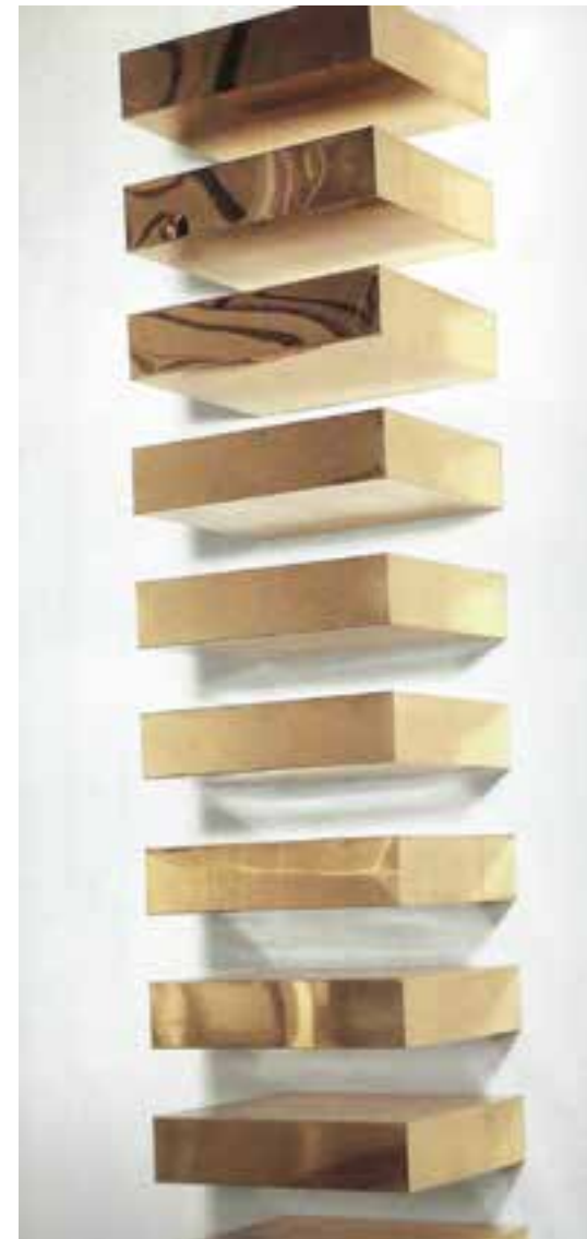
Donald Judd, 10 μέρη από χαλκό, 23x101,6x78,7 εκ.