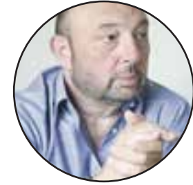
ΤΟΥ ΒΑΣΙΛΗ ΜΑΣΤΟΡΑ

Στην Ελλάδα οι παράγοντες του ποδοσφαίρου μπορεί να χαλάσουν πολύχρονες φιλίες για ένα φαλτσοσφύριγμα του διαιτητή. Μ' αυτό το δεδομένο κανείς δεν μπορεί να εγγυηθεί ότι οποιαδήποτε συμμαχία στον χώρο μπορεί να αντέξει σε βάθος χρόνου. Δυστυχώς στην Ελλάδα, πάνω από το ποδοσφαιρικό προϊόν, μπαίνουν άλλα πράγματα και εκεί μπερδεύεται η ιστορία. Θα ήταν όλη πολύ διαφορετικά αν οι ιδιοκτήτες, σε κοινή γραμμή, προστάτευαν την αξιοπιστία του προϊόντος, προστατεύοντας στην ουσία και τα συμφέροντα της εταιρείας τους. Σ' ένα περιβάλλον υγιούς ανταγωνισμού, ακόμη κι όταν υπάρχουν κακές διαιτησίες, μπορεί το προϊόν να γίνει ελκυστικό. Αρκεί βεβαίως αυτό να είναι η εξαίρεση και όχι ο κανόνας. Πώς μπορεί να γίνει αυτό; Μόνο μ' έναν τρόπο: Να αποφασίσουν οι ιδιοκτήτες να απέχουν από οποιαδήποτε παρέμβαση στον χώρο της διαιτησίας, έχοντας μάλιστα συμφωνήσει ότι δεν θα βγάλουν ανακοινώσεις για ψύλλου πήδημα. Αν συγχρόνως πετύχουν να συντάξουν στην ίδια γραμμή τους οπαδικούς και τους επικοινωνιακούς τους στρατούς, όλα θα είναι διαφορετικά στο εγχώριο επαγγελματικό ποδόσφαιρο. Υπάρχει περίπτωση να γίνει αυτό πράξη στο ελληνικό ποδόσφαιρο; Με τα όσα έχουν γίνει τα προηγούμενα χρόνια και με τον θόρυβο που γίνεται απλώς και μόνο για την επιλογή της έδρας διεξαγωγής του τελικού Κυπέλλου, δύσκολα κάποιος μπορεί να είναι αισιόδοξος.