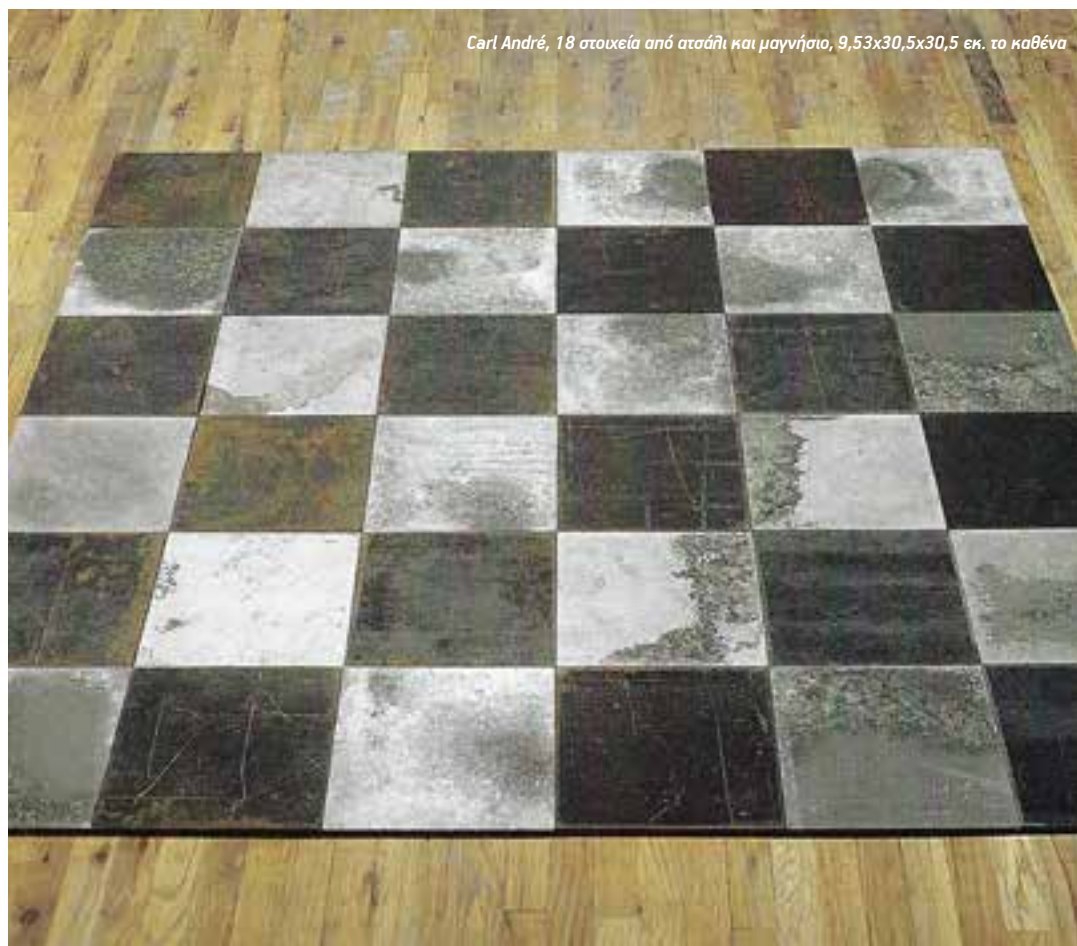
Carl André, 18 στοιχεία από ατσάλι και μαγνήσιο, 9,53x30,5x30,5 εκ. το καθένα

απόσταση του χρόνου αναγνωρίζεται σήμερα ότι ο Γάλλος ριζοσπάστης καλλιτέχνης Marcel Duchamp (1887-1968) που έζησε και στις δύο πλευρές του Ατλαντικού, συνοψίζει με το έργο του την αντίληψη του αιώνα: ότι ο καλλιτέχνης με το έργο του παράγει θεωρία της τέχνης και ότι αρκεί η επιλογή του να ορίσει τι είναι καλλιτεχνικό, για να αναδειχθεί το οποιοδήποτε αντικείμενο σε καλλιτεχνικό έργο. Είναι το παράδειγμα του χρηστικού και βιομηχανικού, έτοιμου (ready-made) Ουρητήριου που το 1917, διεκδίκησε να περιλάβει σε μια καλλιτεχνική έκθεση, στη Νέα Υόρκη. Σαρανταοκτώ χρόνια μετά, το 1965 ο εννοιολογικός Joseph Kosuth (1945), προέβαινε σε μια ανάλογη κίνηση στο έργο, «Υλικό λέξεων σε περιγραφόμενο γυαλί». Μοίραζε σε τέσσερα τζάμια τις τέσσερις λέξεις, ώστε να διαβάζεται η λέξη με την παραπομπή της, ως η ύλη (η λέξη) να αποδίδει τους τρόπους του συσχετισμού της με την άλλη ύλη. Η συγγένεια των μινιμαλιστών με τους εννοιολογικούς καλλιτέχνες στις ΗΠΑ, τα πρώτα χρόνια 1960 ορίζεται από την αναζήτηση της προέλευσης, δηλαδή από την ελάχιστη αναφορά για να αναγνωρίζεται, για παράδειγμα, ένας κύβος, ότι είναι πράγματι κύβος. Η απόρριψη του κάθε περιττού, η αναζήτηση της ακραίας λιτότητας που συμπίπτει με τους συλλογισμούς της λογικής, είναι το έμβλημα των μινιμαλιστών ή της τέχνης του ελάχιστου: είναι η ιδέα ότι αυτό που βλέπεται είναι πράγματι αυτό που βλέπεται και ότι δεν εννοεί κάτι άλλο από αυτό που βλέπεται.