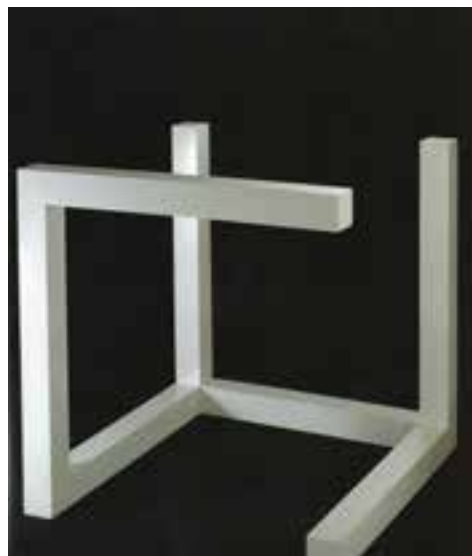
Sol Lewitt, ανοιχτός κύβος, αλουμίνιο πλακέ, 105x105x105 εκ.

*Η Εύη Κυρμακίδου είναι εικαστικός υποψήφια διδάκτωρ Πολυτεχνείου Κρήτης