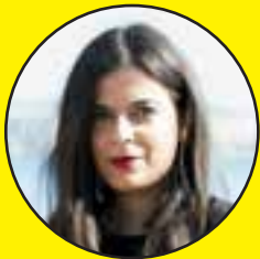
ΑΠΟ ΤΗ ΦΙΛΙΠΠΑ ΒΛΑΣΤΟΥ