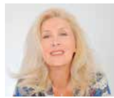
ΑΠΟ ΤΗΝ ΑΛΕΞΑΝΔΡΑ ΚΑΡΤΑ

Εβδομαδιαίες προβλέψεις 1 έως 7 Ιουλίου 2024