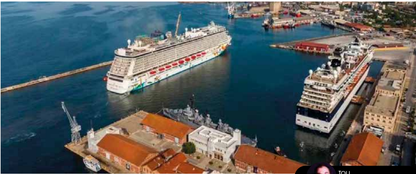
ΤΟΥ Δημήτρη Δραγώγια