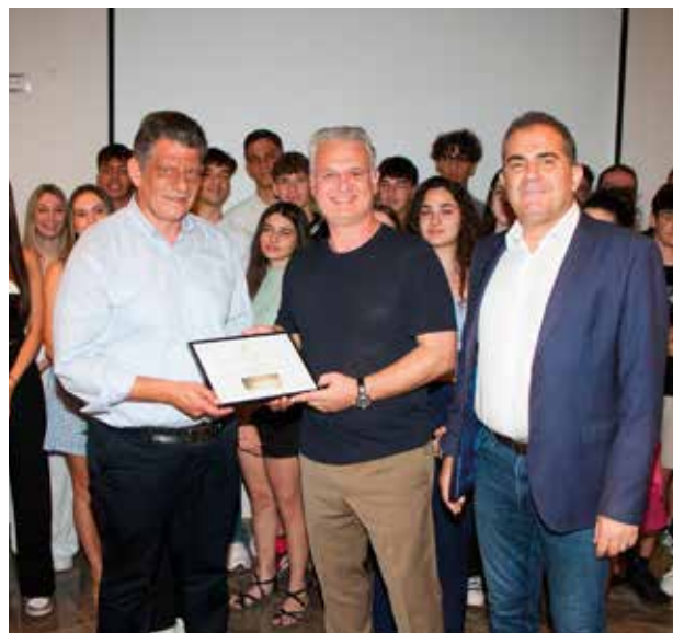
Ο κ. Δημήτρης Πτωχός, Περιφερειάρχης Πελοποννήσου, ο κ. Αθανάσιος Βασιλόπουλος, Δήμαρχος Καλαμάτας, με τον Μεγάλο Νικητή του Διαγωνισμού του Τμήματος Β3, 2ο Λύκειο Καλαμάτας

ΜΑΘΗΤΕΣ ΑΠΟ 200 ΣΧΟΛΙΚΑ ΤΜΗΜΑΤΑ ΤΩΝ 13 ΔΗΜΩΝ ΤΗΣ ΠΕΡΙΦΕΡΕΙΑΣ ΠΕΛΟΠΟΝΝΗΣΟΥ ΣΥΜΜΕΤΕΙΧΑΝ ΕΝΕΡΓΑ ΣΤΟ ΔΙΑΓΩΝΙΣΜΟ ΤΗΣ TEXAN ΔΕΙΧΝΟΝΤΑΣ ΤΟΝ ΔΡΟΜΟ ΓΙΑ ΕΝΑ ΠΙΟ ΒΙΩΣΙΜΟ ΜΕΛΛΟΝ. ΣΥΝΟΛΙΚΑ ΑΝΑΚΥΚΛΩΘΗΚΑΝ 3.200.000 ΥΛΙΚΑ!