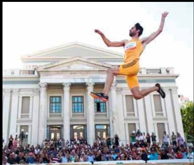
Ο Μίλτος Τεντόγλου ίπταται στο δημαρχείο Πειραιά