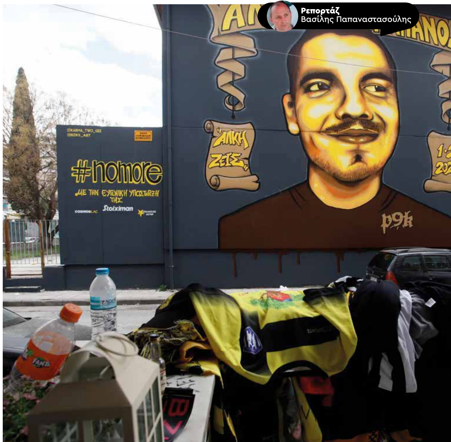
Ρεπορτάζ Βασίλης Παπαναστασούλης

Απορρίπτοντας τους ισχυρισμούς των κατηγορουμένων περί μεταβολής της κατηγορίας σε μη σκοπούμενη ή σκοπούμενη θανατηφόρα σωματική βλάβη, το δικαστήριο απαντάει ως εξής: Στον ενδεχόμενο δόλο ο δράστης όχι μόνο προβλέπει το εγκληματικό αποτέλεσμα αλλά και αποδέχεται αυτό, σε αντίθεση με την ενσυνείδητη αμέλεια που δεν υπάρχει αποδοχή του αποτελέσματος από τον δράστη.