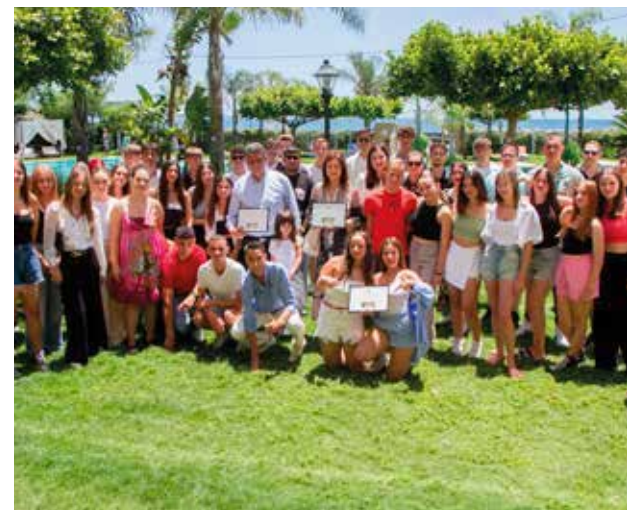
Τα τρία νικητήρια τμήματα του Μεγάλου Εκπαιδευτικού Διαγωνισμού Ανακύκλωσης των Δήμων Περιφέρειας Πελοποννήσου

ΜΑΘΗΤΕΣ ΑΠΟ 200 ΣΧΟΛΙΚΑ ΤΜΗΜΑΤΑ ΤΩΝ 13 ΔΗΜΩΝ ΤΗΣ ΠΕΡΙΦΕΡΕΙΑΣ ΠΕΛΟΠΟΝΝΗΣΟΥ ΣΥΜΜΕΤΕΙΧΑΝ ΕΝΕΡΓΑ ΣΤΟ ΔΙΑΓΩΝΙΣΜΟ ΤΗΣ TEXAN ΔΕΙΧΝΟΝΤΑΣ ΤΟΝ ΔΡΟΜΟ ΓΙΑ ΕΝΑ ΠΙΟ ΒΙΩΣΙΜΟ ΜΕΛΛΟΝ. ΣΥΝΟΛΙΚΑ ΑΝΑΚΥΚΛΩΘΗΚΑΝ 3.200.000 ΥΛΙΚΑ!