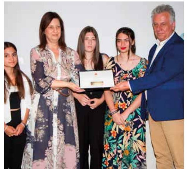
Ο κ. Ιωάννης Γεωργόπουλος, Δήμαρχος Ερμιονίδας απονέμει το 3ο βραβείο-έπαθλο στο Τμήμα Α, 2ο Λύκειο Ερμιόνης