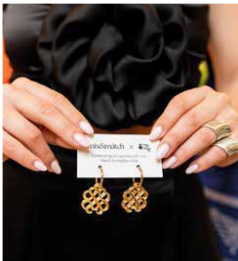
Το ιδιαίτερο δώρο της Mix&Match για τους καλεσμένους